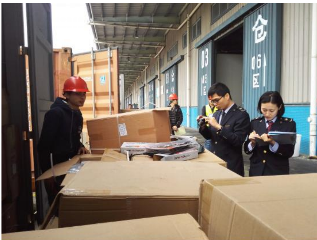
南沙出入境检验检疫局工作人员在抽检外贸商品。