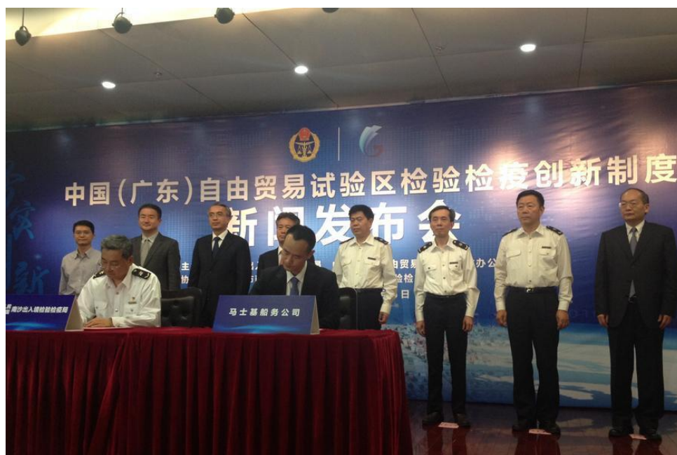
广东自贸区 11 项检验检疫创新制度在南沙港发布